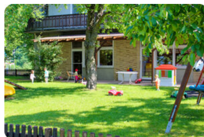
Image-Broschüre Test Ein Test-Download von uns